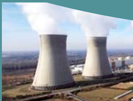
LE NUCLÉAIRE RESPECT DU CAHIER DES CHARGES RCCM