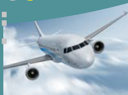
L'AÉRONAUTIQUE ÉLÉMENTS MÉCANIQUES