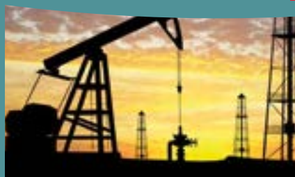
LE PÉTROLE ROBINETTERIE INDUSTRIELLE ET MATÉRIEL DE FORAGE