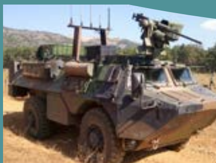
L'ARMEMENT DIFFÉRENTES PIÈCES D'ARTILLERIE