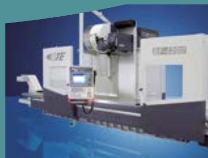
LA MACHINE OUTILS COMPOSANTS MÉCANIQUES