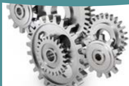
L'INDUSTRIE AUTOMOBILE ENGRENAGES, ARBRES À CAME, PIGNONS, ETC...